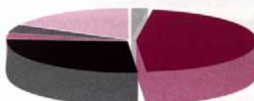
Recettes de fonctionnement