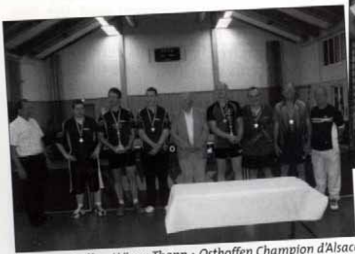
Finale Osthoffen / Vieux-Thann • Osthoffen Champion d'Alsace