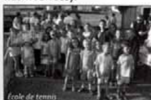
École de tennis