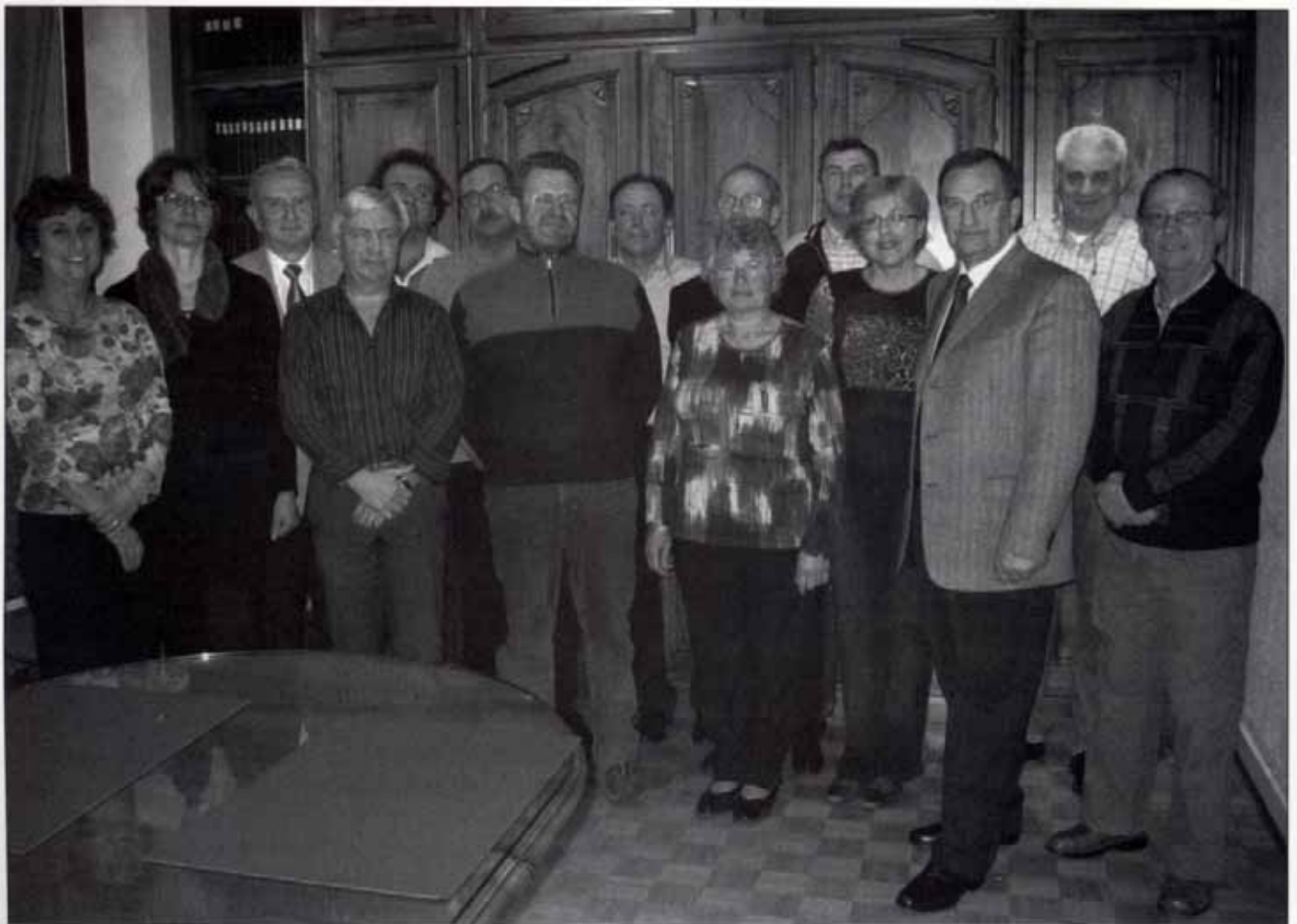
Le nouveau Conseil Municipal depuis Mars 2008